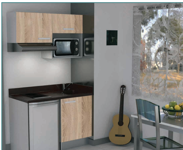
K120 haut et bas, avec : PlaniQuartz Nero 120 cm et façades Bardolino

Présentée ci-dessus en version basse avec PlaniQuartz 120 cm Cromo , une porte, façade coloris Blanc Mat, un jambage coloris Lino et un emplacement pour un réfrigérateur.