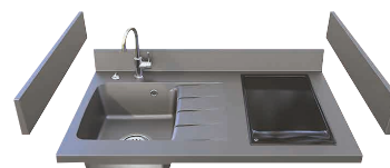
PlaniQuartz et crédences (en option)