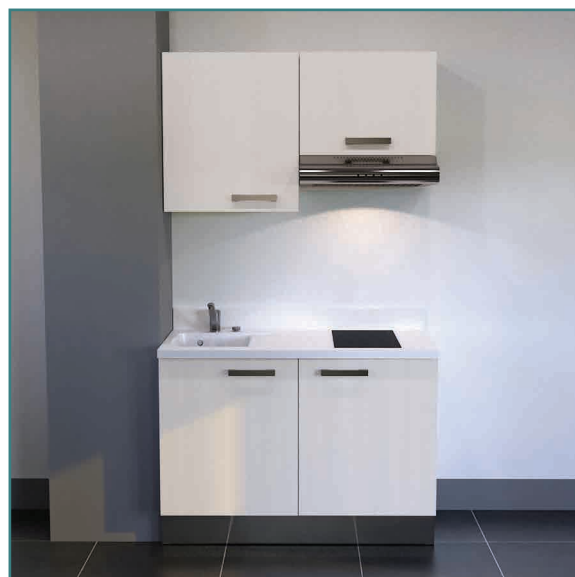
K120 haut et bas, avec : PlaniQuartz Snova 120 cm et façades Blanc Mat